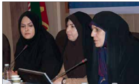
برگزاری کارگروه تخصصی امور بانوان آذربایجان شرقی با حضور معاون رئیس جمهور در تبریز