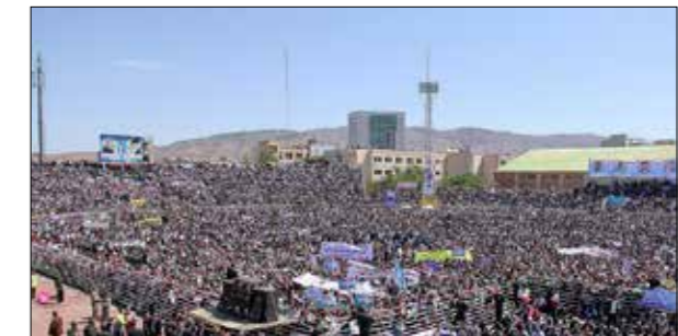
سخنرانی رئیس جمهور در استادیوم تختی تبریز