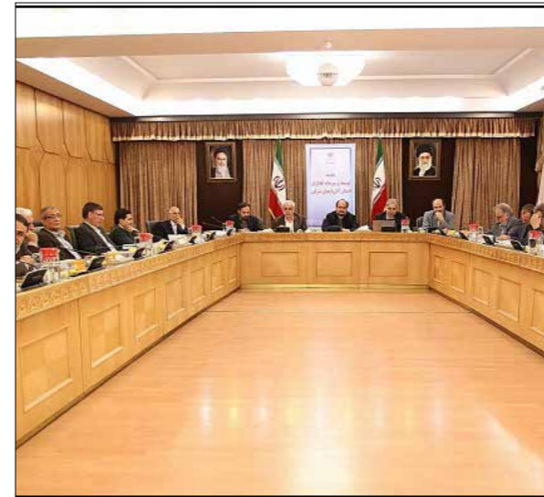
فرصت های سرمایه گذاری استان آذربایجان شرقی از سوی مسئولان استان و مدیران دستگاهها و سازمان های توسعه ای و بانک ها ارائه شد.

در این جلسه فهرستی جامع و مفصل از ظرفیتهای، استعدادها و