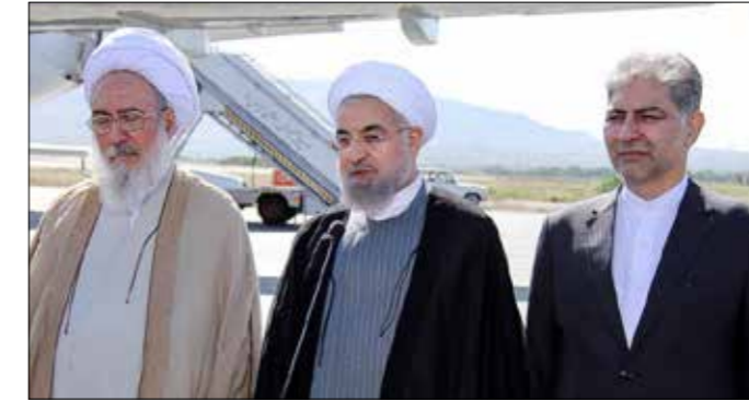
استقبال رسمی مقامات آذربایجان شرقی از رئیس جمهور در فرودگاه بین المللی شهید مدنی تبریز