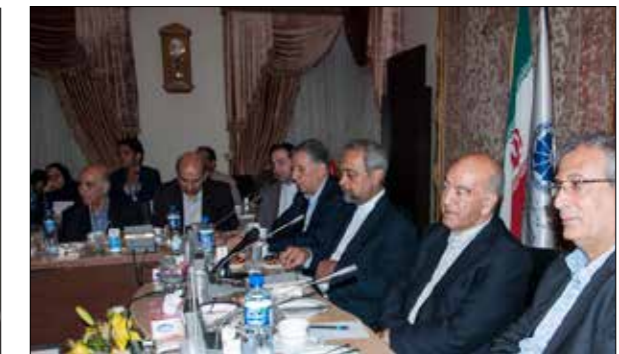
نشست «نهادنبدان» با فعالان اقتصادی آذربایجان شرقی