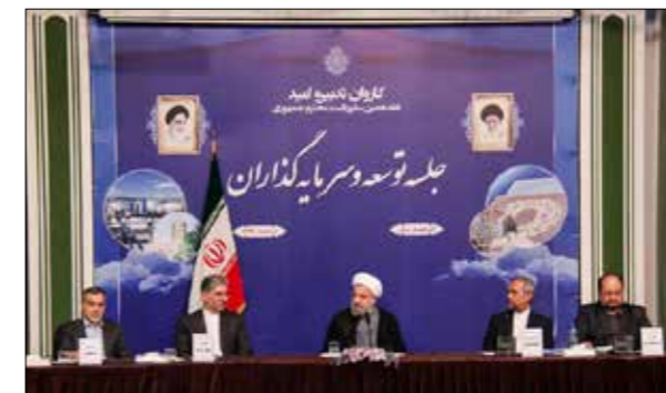
دیدار رئیس جمهور روحانی با فعالان اقتصادی آذربایجان شرقی