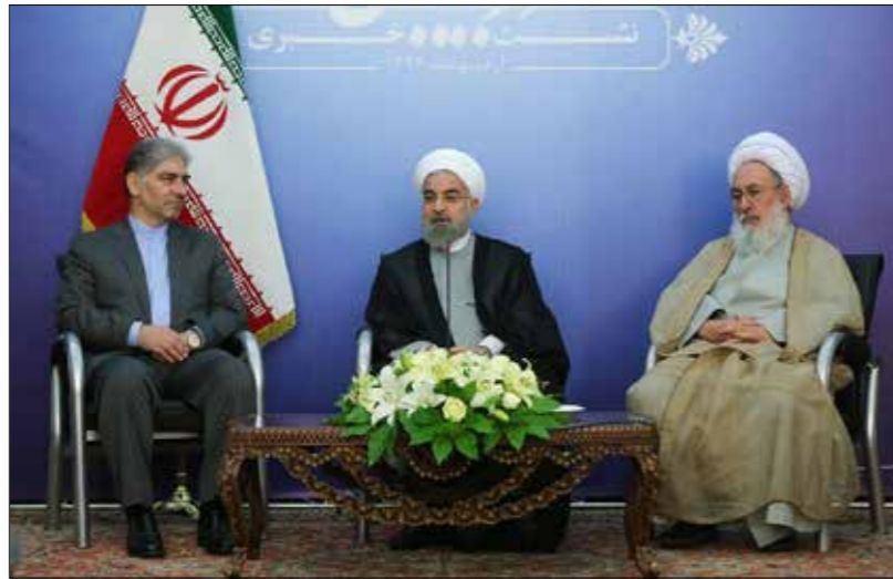
نشست مطبوعاتی رئیس جمهور در تبریز