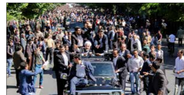
استقبال مردم از رئیس جمهور در تبریز