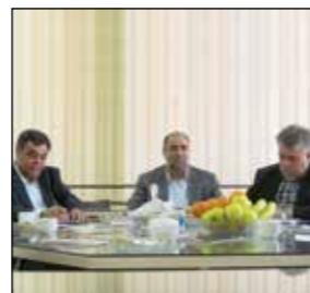
میزگردی با حضور نماینده دولت، نماینده بخش خصوصی و دبیر اجرایی تشکیلات خانه کارگر تبریز