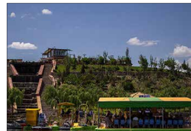
بازدید معاون رئیس جمهور از دهکده توریستی سد امند