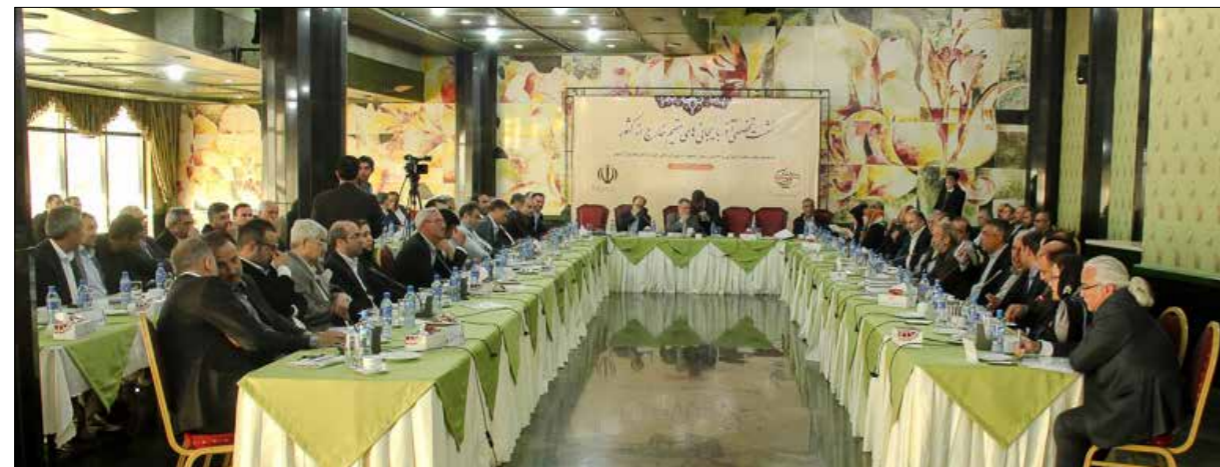
نشست آذربایجانی های مقیم خارج از کشور در تبریز