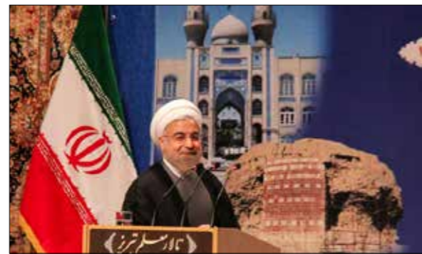
دیدار رئیس جمهور با علما، ایشارگران و برگزیدگان آذربایجان شرقی